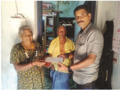
ഫെബ്രുവരി 21 ന് മേപ്പാടി മുണ്ടക്കൈ ദുരന്തബാധിതരായ 2 പേരുടെ വീടുകൾ സന്ദർശിച്ചു ചികിത്സാ സഹായം കൈമാറി.